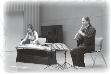
全体会：コンサート&お楽しみ