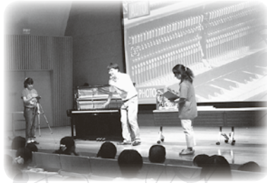
ピアノのワークショップ