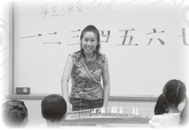
箏のワークショップ